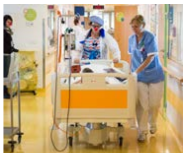
Program NOS! (Na operační sál!) jsme rozšířili do čtvrté nemocnice – Plzně.