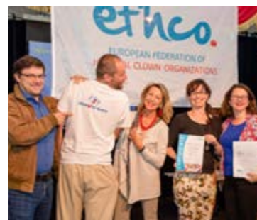
Zdravotní klaun získal Certifikát kvality od European Federation of Hospital Clown Organisations.